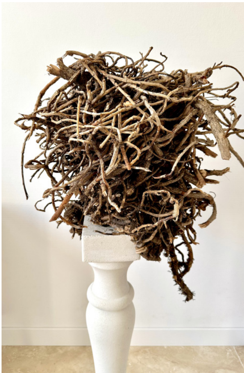
GRIFFES DU LIERRE, 2025, détail, lierre, colonne antique de jardin, pierre, 13 X 13 X 116 cm.