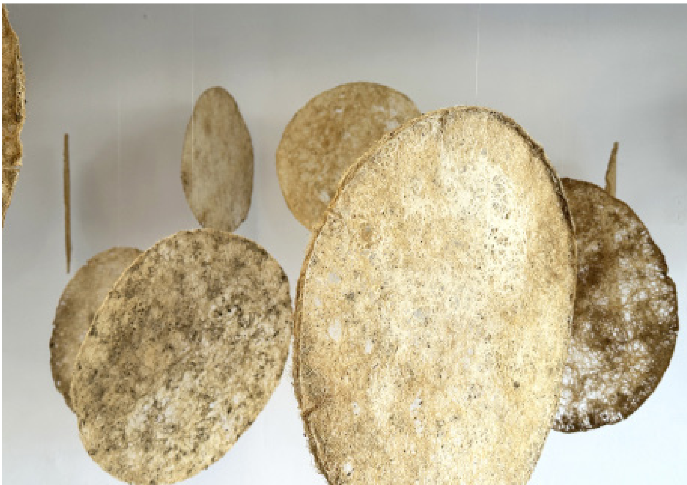
L' INTERCONNECTIVITÉ DE L'UNIVERS, 2025, détail, multiple grands formats, détail, racines suspendues, diamètre 47 cm.