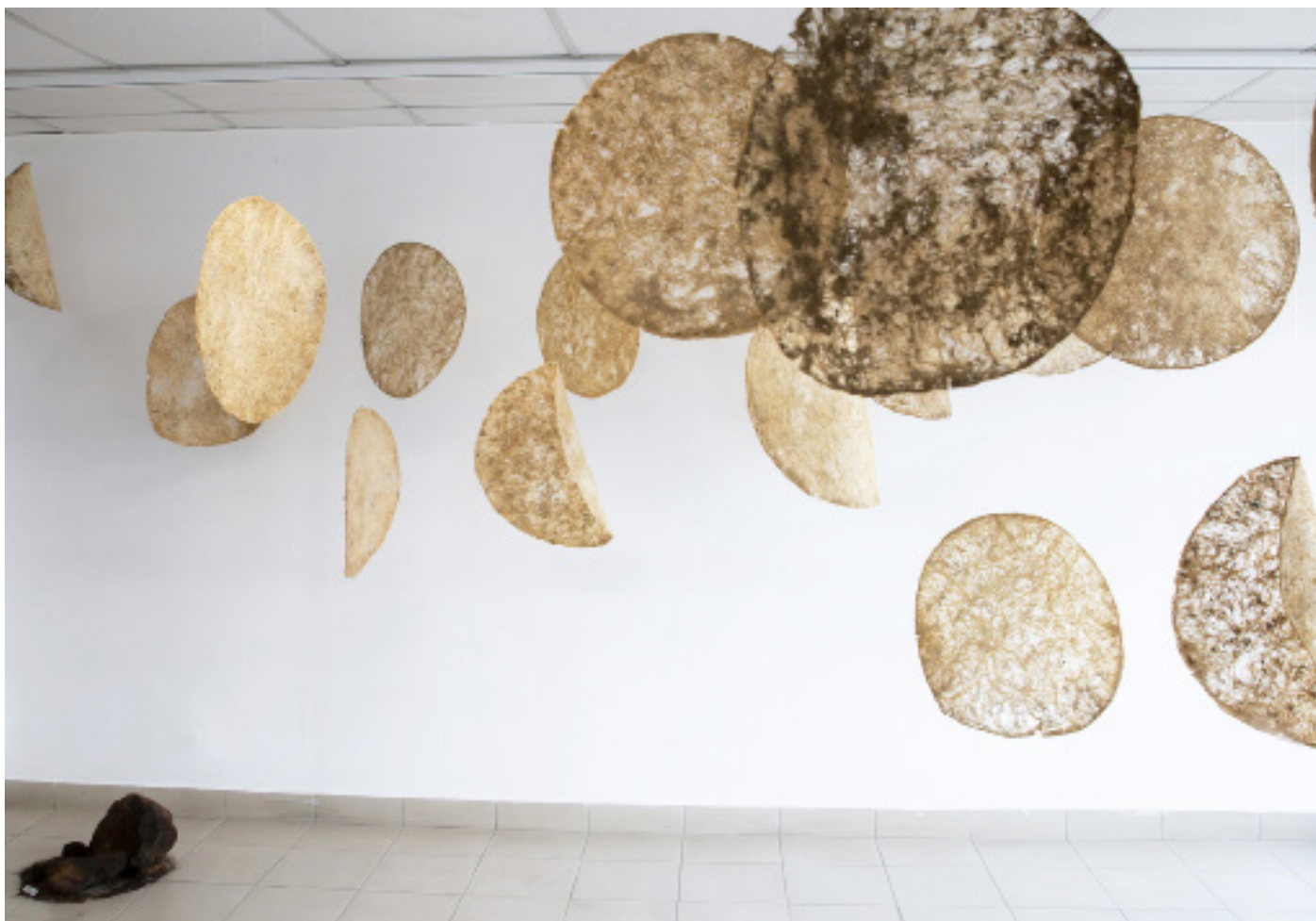
L'INTERCONNECTIVITÉ DE L'UNIVERS, 2025, multiple grands formats, racines suspendues, diamètre 47 cm.