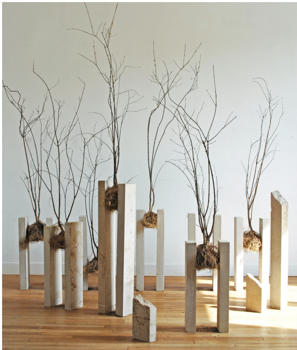
CONSTRUIRE LA RÉSILIENCE, DEMAIN NE SERA PAS SON DERNIER SOMMEIL 2020, installation 2, arbustes «fusain», racines, pierre de Hauteville, dimensions variables.