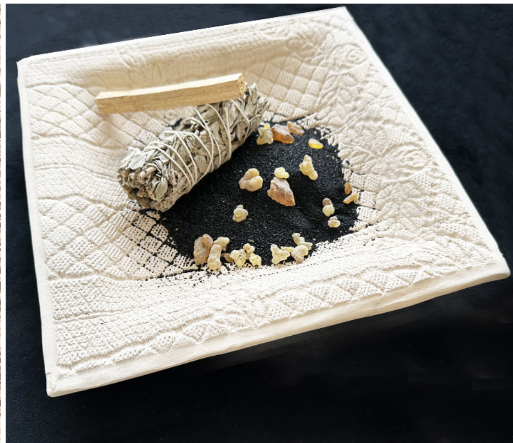
PER FUMUM, À TRAVERS LA FUMÉE, 2025, détail photographie sur velours, Assiettes en argile brut ornées d'emprunts végétales contenant du sable noir volcanique, résine d'arbres, Myrrhe, Copal, Oliban, bâton de Palo Santo, rouleaux de Sauge, 110 x 159 cm.