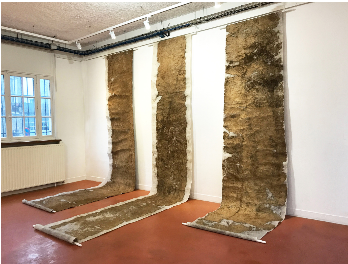
PRESSION ANTHROPIQUE 2023, toiles géotextile, racines, terre, 85 X 580 cm (X1), 85 X 85 cm (X2).